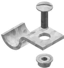
Befestigungsbügel SLOS HDKLIE HDBKID25