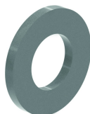
Rondelle (DIN 125-1 A) I6RO