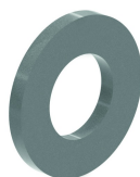
Rondelle (DIN 125-1 A) I6RO