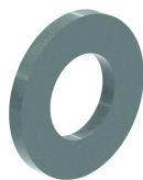
Rondelle (DIN 125-1 A) I6RO