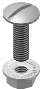
Boulon et écrou autobloquant VM