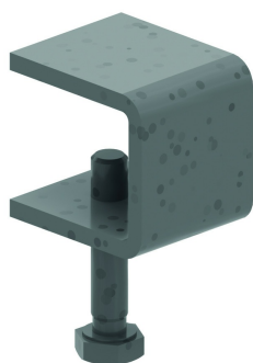
Attache couvercle ZMDKIG

Pour des largeurs > ou = 400 mm, le couvercle est pourvu de nervures de renforcement.