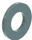
Rondelle (DIN 125-1 A) RO