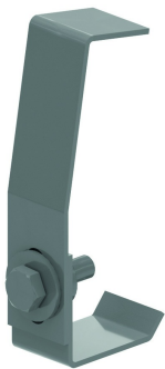
Dekselklem voor HDKLIE DKI