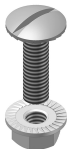
Zelfborgende moer en bout VM